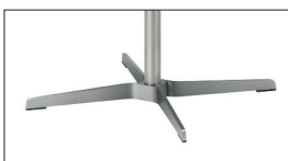
Flachstahl Stainless steel