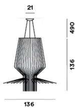
SCHÉMA ET ÉMISSION DE LUMIÈRE