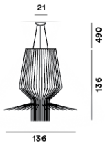
SCHÉMA ET ÉMISSION DE LUMIÈRE