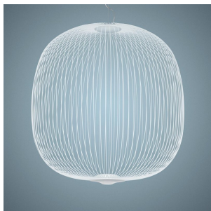
Spokes 2 Large