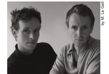
By M. Le Gall

Geboren in Frankreich in den 70er Jahren. Mit einer ersten wichtigen Arbeit für Issey Miyake im Jahr 2000 beginnen sie, sich mit Design zu beschäftigen. In wenigen Jahren werden die Bilder ihrer Werke bereits in zwei Monographien, in den „Catalogue de Raison“ und danach in die Veröffentlichung von Phaidon im Jahre 2003 aufgenommen. Die Brüder Bouroullec werden als die neuen Sterne am Designerhimmel angesehen, sie sind jung und präzise, nachdenklich und gleichzeitig leidenschaftlich; ihre Projekte sind echte „Mikroarchitekturen“, die für verschiedene Funktionen und zur Charakterisierung und Änderung der Räume, für die sie bestimmt sind, eingesetzt werden können.