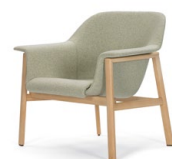
SEDAN LOUNGE CHAIR 2013