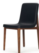
SEDAN CHAIR 2015