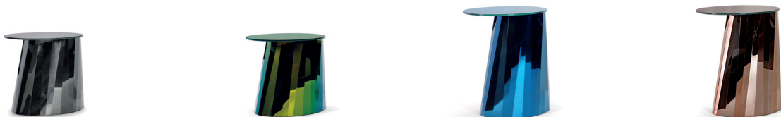
PLI SIDE TABLE LOW 2016