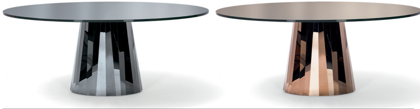
Onyx-schwarz, Tischplatte vollflächig lackiert Onyx black, tabletop fully lacquered

Mesa. Pie de chapa plegada de acero inoxidable pulido al brillo en diversos colores. La coloración se ha aplicado utilizando un procedimiento especial. Tablero ovalado de cristal, lacado en color axial o en toda la superficie, brillante. Patines regulables en altura.