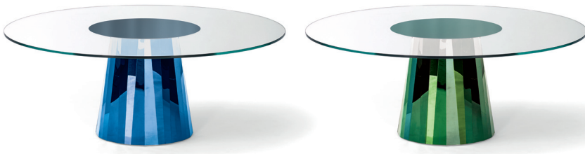
Saphir-blau, Tischplatte mittig lackiert Sapphire blue, tabletop lacquered in its centre