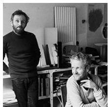
Ronan & Erwan Bouroullec

Ronan Bouroullec (born 1971) and Erwan Bouroullec (born 1976) have been working together for about twenty years now. Their collaboration is a permanent dialogue nourished by their distinct personalities and a shared notion of diligence with the intention to reach more balance and fineness. Their work has covered many fields ranging from the design of small objects as jewellery to spatial arrangements and architecture, from craftsmanship to industrial scale, from drawings to videos and photography. They have collaborated with leading design companies such as Vitra, Cassina, Artek, Danskina, Magis, Alessi, Galerie kreoo, Established & Sons, Axor Hansgrohe, Flos, Kvadrat, Glas Italia, Kartell, Kettal, Iittala, Cappellini, Ligne Roset, Nani Marquina, Mattiazzi, Mutina, Samsung and Hay. Designs of Ronan & Erwan Bouroullec are part of select international museums' permanent collections and several exhibitions have been devoted to their work including the Design Museum, London, the Museum of Contemporary Art, Los Angeles, the Centre Pompidou Metz, the Museum of Contemporary Art, Chicago, the Musée des Arts Décoratifs in Paris, the Vitra Design Museum or the FRAC Bretagne. The Bouroullec studio is located in Paris, and the whole team numbers around eight people. To discover more about Ronan & Erwan Bouroullec's work, please visit www.bouroullec.com