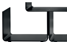
Finish Maple painted Black