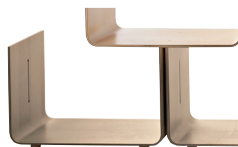
Finish Natural Maple