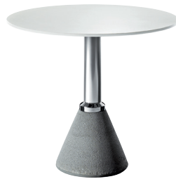
Indoor use Frame: Natural Glossy Top: White 8500